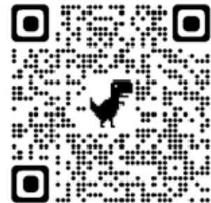
申込 QR コード

https://docs.google.com/forms/d/1R5kKt3tpnix2ziLyVDmWkaFpnuNFdTUilz2nOu_km4Q/edit