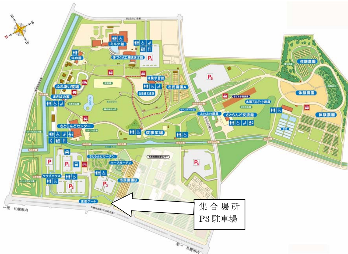
サッポロさとらんど P3 駐車場（北海道札幌市東区丘珠町 584-2）

9. 問い合わせ先：拓殖大学北海道短期大学 担当 上西 TEL0164-23-4111 緊急時 携帯 090-2072-0657